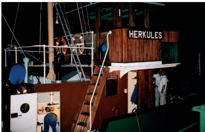
Det var mycket folk på kajen i Karlskrona och även sent på kvällen var folk ombord och tittade på Herkules .