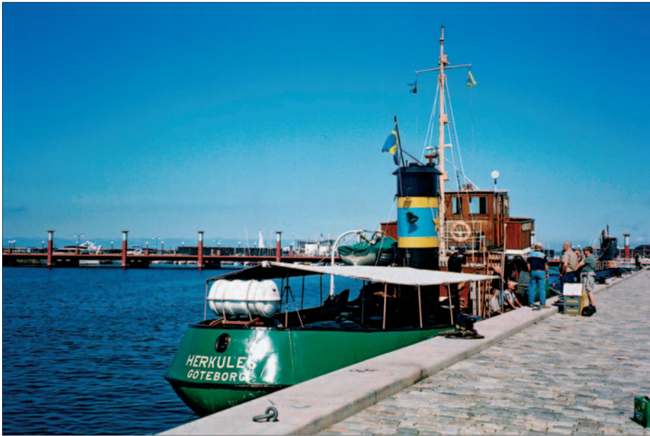
Herkules fick äran av att ligga vid den fina kryssningskajen i Helsingborg.