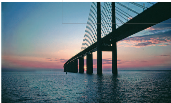
En grann solnedgång då vi passerade Öresundsbron.