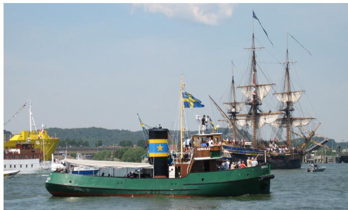
Herkules välkomnar Ostindiefararen Göteborg efter återkomsten från Kina 2007.

Härmed kallas medlemmarna i Bogserbåten Herkules ekonomisk förening till ordinarie årsmöte lördagen den 13 juni, kl. 10:30. Stämman hålls på Herkules akterdäck vid Göteborgs Maritima Centrum vid Packhusplatsen Göteborg. På grund av den rådande pandemin kommer stämman hållas utomhus och under så kort tid som möjligt. Respektera Folkhälsomyndighetens råd om smittspridningen. Vi ber er hålla minst armlängd avstånd till varandra och inte komma om ni känner er sjuka.